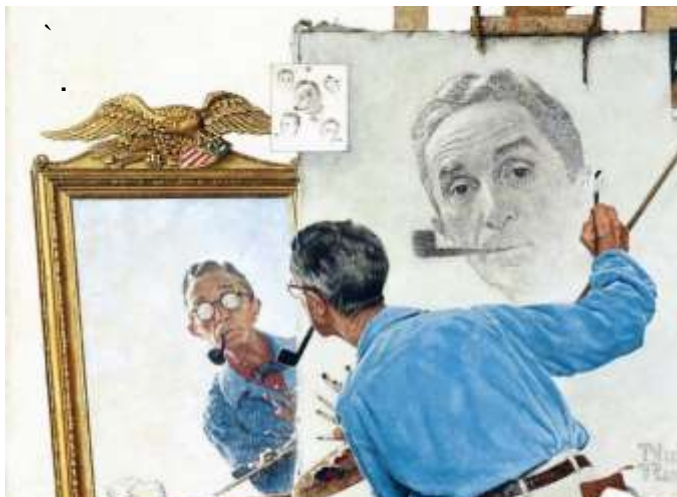
Auto-portraits Norman Rockwell 1960

Il s'agit donc de questionner le portrait d'un personnage.