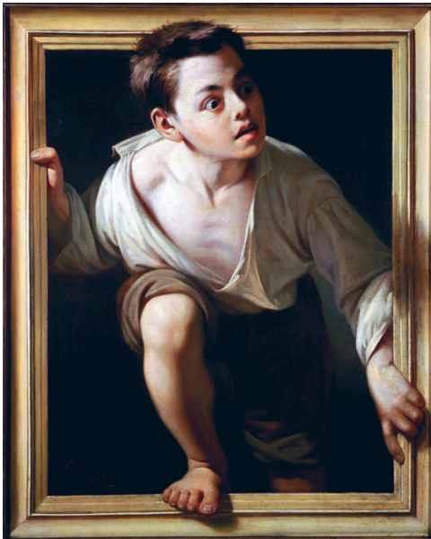
Échapper à la critique , Pere Borrell del Caso, 1874

Selon toi, pourquoi ce personnage sort du cadre de ce tableau ?